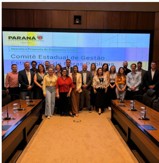
Estado realiza primeira reunião do Comitê de Gestão Estratégica de Obras Públicas

O Governo do Paraná realizou a primeira reunião ordinária do Comitê Estadual de Gestão Estratégica de Obras Públicas (CEGEOP), instituído pelo Decreto nº 12.821/2026, com o objetivo de fortalecer o planejamento, a coordenação e o acompanhamento das obras públicas no Estado. O encontro reuniu representantes de diversos órgãos para alinhar diretrizes, apresentar os membros do comitê e discutir a proposta de Regimento Interno, fundamental para assegurar eficiência, transparência e segurança jurídica. Também foram apresentadas atualizações sobre as Unidades Técnicas de Engenharia e Arquitetura (UTEAs) e sobre a contratação de um sistema informatizado para monitoramento das obras. O CEGEOP atuará por intermédio de projetos e grupos de trabalho temáticos, buscando modernizar a gestão pública, qualificar os investimentos e ampliar a efetividade das obras entregues à sociedade.