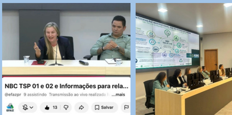
NBC TSP 01 e 02 e Informações para rela... @efazpr 9 assistindo Transmissão ao vivo realizada t...mais

A Diretoria de Contabilidade Geral (DCG) realizou uma reunião presencial para alinhar tecnicamente as normas NBC TDS 01 e NBC TDS 02, relacionadas à divulgação de informações financeiras sobre sustentabilidade e clima. O encontro também discutiu a elaboração de relatórios de sustentabilidade, focando na agenda ESG, relevante para a gestão pública. A reunião foi transmitida ao vivo pelo YouTube.